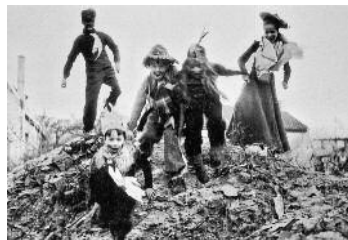
Peter Fischer Köln, Karneval 1946